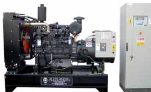
MOD. DF160C6ST15/3 - 135 KVA (Q. AUT. IS 80) GRUPPI ELETTROGENI ESECUZIONE APERTA CON MOTORI DIESEL "IVECO" SERIE NEF DA 50 A 800 KVA