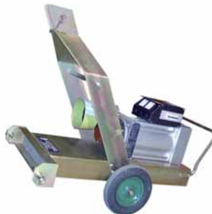
MOD. AC54T3.S3/B3P.MG GENERATORE AGRICOLO ESECUZIONE B3P/M 42 KVA 3000 GIRI CON SUPPORTO MOBILE "G" PER APPLICAZIONE AL 3° PUNTO DEL TRATTORE