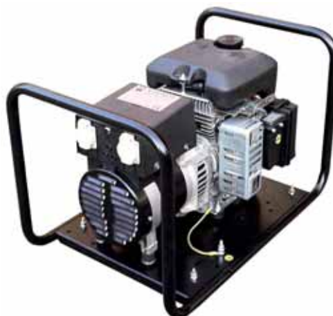
MOD. BI4C1M3/1 - 3 KVA PICCOLI GRUPPI MONOFASI E TRIFASI CON MOTORE "LOMBARDINI" DA 3 A 7,5 KVA