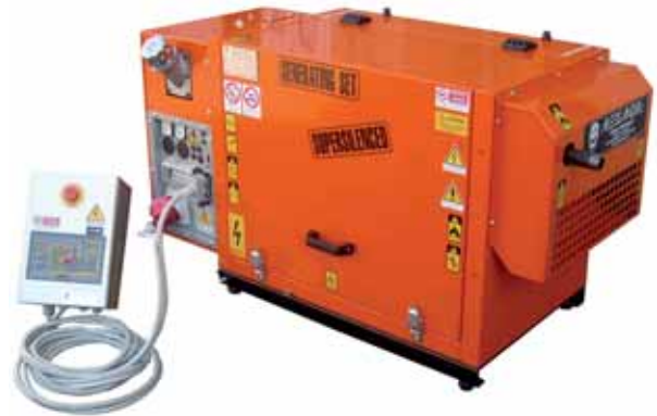
MOD. DL7C1T3/3 BOX 95 - 7 KVA GRUPPI ELETTROGENI MONOFASI E TRIFASI CON MOTORI DIESEL "LOMBARDINI" INSONORIZZATI CON AVVIAMENTO MANUALE E AUTOMATICO