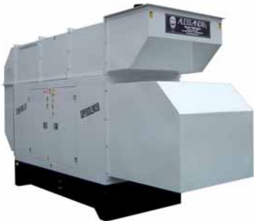
MOD. DF190C6ST15/3 BOX 80 GRUPPO ELETTROGENO IPERINSONORIZZATO DA 160 KVA DB/A 55