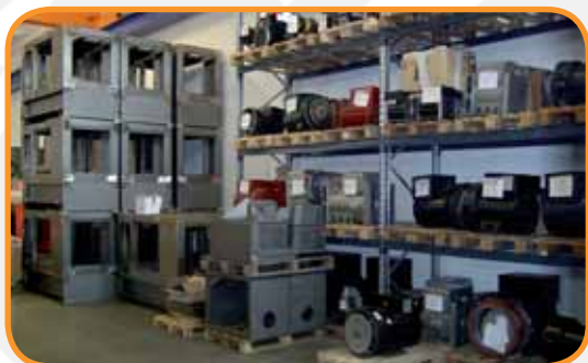
"MAGAZZINO" PARTE SEMILAVORATI

La ditta ALESSANDRI S.r.l., produce e propone alla clientela una ampia gamma di gruppi elettrogeni che spazia dal piccolo portatile al 2000 KVA, inoltre produce una vastità di altri articoli elettrotecnici tra i quali: Generatori agricoli, Elettrocompressori, Motocompressori, Torri d'illuminazione, Motopompe cantieristiche e per irrigazione, nonché Gruppi di pressurizzazione antincendio a norme UNI 9490. Le morfologie costruttive sono le più disparate e mirate, per consentire di centrare sempre gli obiettivi richiesti, al fine di ottenere la totale soddisfazione del cliente. Ogni prodotto nasce da un progetto studiato e dimensionato secondo direttiva "CE" che consente la realizzazione del macchinario in linea con la direttiva macchine. Nessun articolo costruito viene immesso sul mercato se non sottoposto ad un attento e accurato controllo, nonché al superamento di un severo collaudo, che consente al cliente di acquistare un prodotto di indiscussa qualità e di massima affidabilità. La progettazione, il dimensionamento, il noleggio, la riparazione di qualsiasi gruppo elettrogeno insieme ad un magazzino fornito di tutti i ricambi, sono servizi che ALESSANDRI S.r.l. è in grado di cedere con serietà, concretezza e cognizione di causa. Lo staff ALESSANDRI è composto da tecnici preparati e competenti che pongono l'azienda ai vertici di un'unanime e favorevole consenso, testimone ne è il fatto che i nostri stessi clienti sono per noi i nostri migliori referenti.