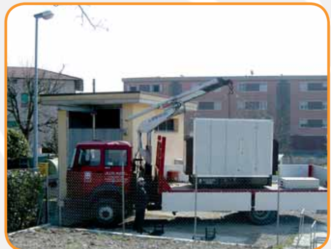
SERVIZIO DI CONSEGNA, SCARICO E POSIZIONAMENTO