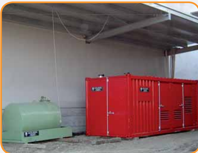
GRUPPO ELETTROGENO INSONORIZZATO DA 800 KVA CON CISTERNA DI STOCCAGGIO CARBURANTE