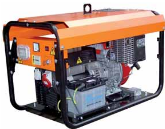
MOD. BI7C1T3/2 (FULL OPTIONALS) - 6,5 KVA GRUPPO ELETTOGENO TRIFASE STAZIONARIO ESECUZIONE CANTIERISTICA