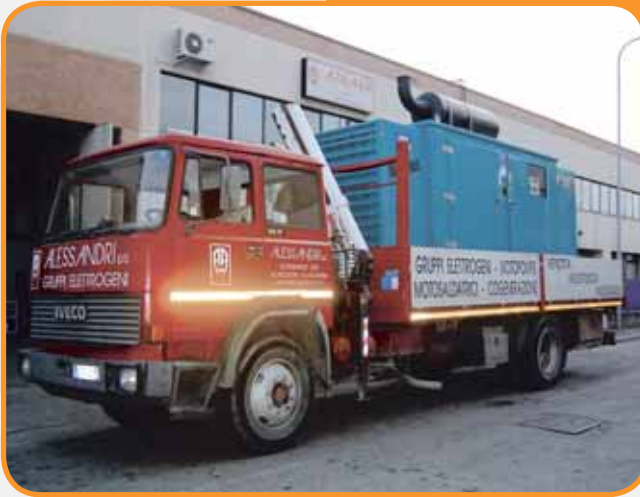
SERVIZIO DI TRASPORTO DIRETTO

UNA NUTRITA FLOTTA DI GRUPPI ELETTROGENI PRONTI PER L'USO DA 1 A 1000 KVA PER GARANTIRE L'IMMEDIATA ESIGENZA DI ENERGIA