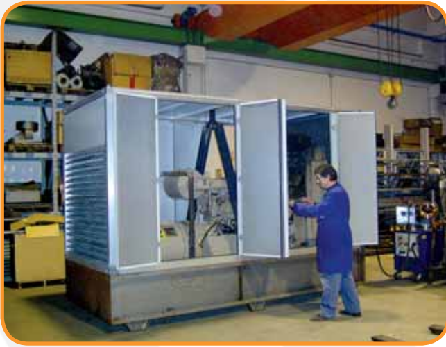
"PRODUZIONE" REPARTO MONTAGGI