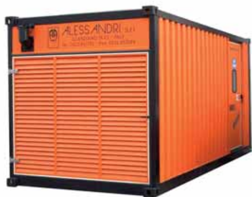
MOD. DP1500V12ST15/3.20P/90 GRUPPO ELETTROGENO IN CONTAINER INSONORIZZATO DA 1240 KVA DB/A 70