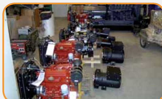
"PRODUZIONE" REPARTO ASSEMBLAGGI