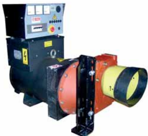
MOD. ACU72T15E.ST2/B GENERATORE AGRICOLO ESECUZIONE BASE 65 KVA 1500 GIRI CON REGOLAZIONE ELETTRONICA

POTENZE DA 6 A 65 KVA APPLICABILI ALLA PRESA DI FORZA DEL TRATTORE MONOFASI E TRIFASI