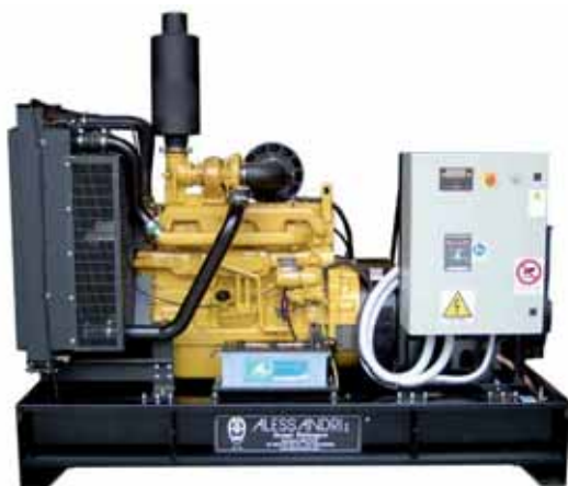
MOD. DJD295C6ST15/2 - 250 KVA (Q. MAN ST2) GRUPPI ELETTROGENI ESECUZIONE APERTA CON MOTORI DIESEL "JOHN DEERE" DA 30 A 250 KVA