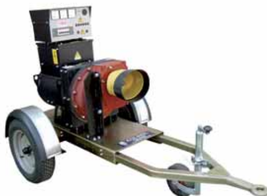
MOD. ACU60T15E.ST2/CAR GENERATORE AGRICOLO ESECUZIONE MOBILE PER TRAINO LENTO 50 KVA 1500 GIRI CON REGOLAZIONE ELETTRONICA