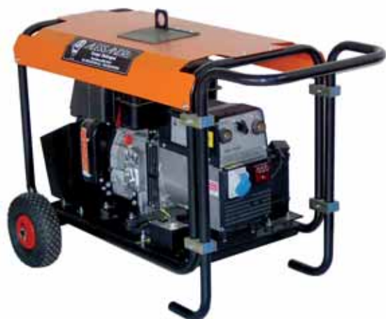
MOD. DL4C1M3/2 SCC 170 (FULL OPTIONS) MOTOSALDATRICE CON MOTORE DIESEL LOMBARDINI SALDATRICE 170 A E GENERATORE MONOFASE 3,5 KVA