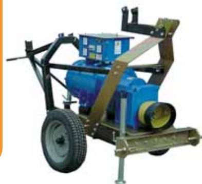
MOD. TA/GA 5500/4 X 1000 W TORRE H MT. 5,5 ESECUZIONE SPECIALE PER APPLICAZIONE ALLA PRESA DI FORZA DEL TRATTORE CON GENERATORE MOD. ACU42T15/B3PM 40 KVA