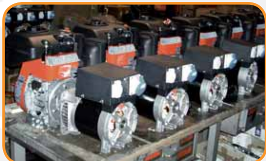
"PRODUZIONE" LAVORAZIONI A BANCO