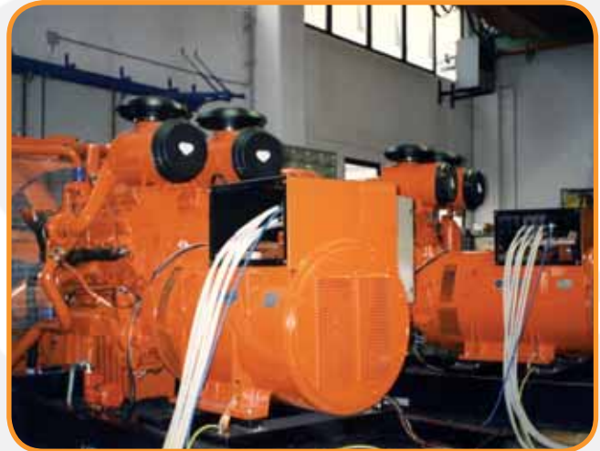
"SALA PROVE" PROVA CONTEMPORANEA DI N.2 GRUPPI DA 500 KVA