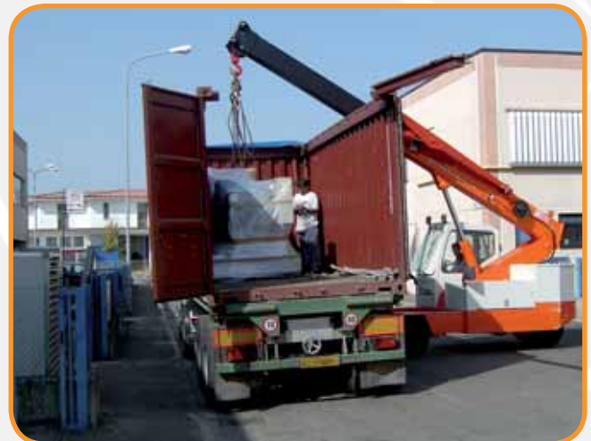
CARICO CON GRU SEMOVENTE 20 TON