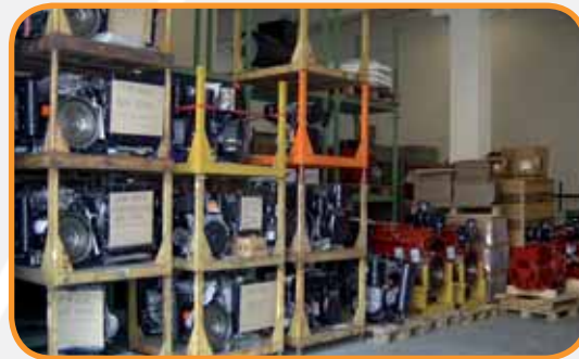
"MAGAZZINO" PARTE MOTORI