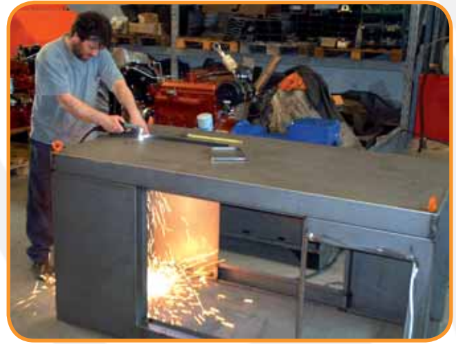
"PRODUZIONE" REPARTO CARPENTERIA