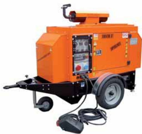
MOD. DIS20C3T3/2 SCC 400 BOX 95 MOTOSALDATRICE CON MOTORE DIESEL ISUZU SALDATRICE 400 A E GENERATORE TRIFASE 16,5 KVA ESECUZIONE MOBILE BIGA INSONORIZZATA DB/A 70