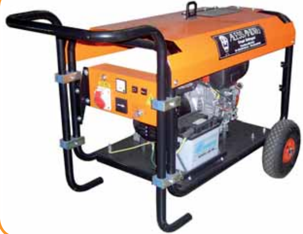
MOD. DL7C1T3/2 (FULL OPTIONALS) - 7 KVA GRUPPO ELETTROGENO TRIFASE MOBILE ESECUZIONE CANTIERISTICA