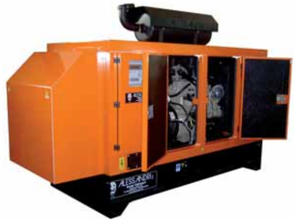
MOD. DJD120C6ST15/3 BOX 90 GRUPPO ELETTROGENO INSONORIZZATO DA 100 KVA DB/A 65