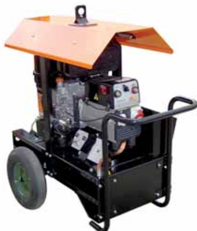
MOD. DL7C1T3/2 SCC 220 (FULL OPTIONS) MOTOSALDATRICE CON MOTORE DIESEL LOMBARDINI SALDATRICE 220 A E GENERATORE TRIFASE 6,5 KVA