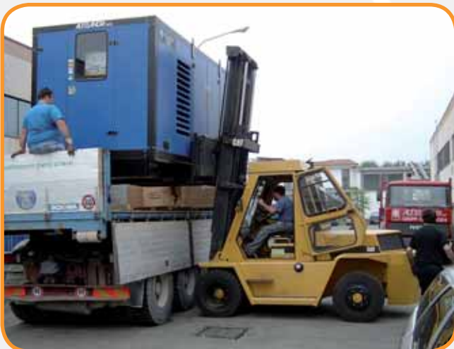
CARICO CON CARRELLO ELEVATORE 80 QLI