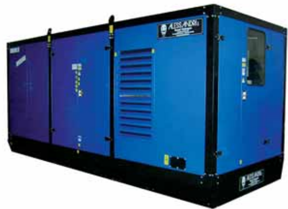
MOD. DP775V12ST15/3 BOX 95 GRUPPO ELETTROGENO INSONORIZZATO DA 650 KVA DB/A 70