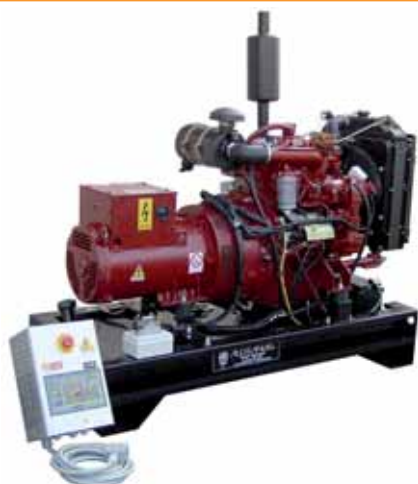
MOD. DF40C3T15/3 - 30 KVA (Q. AUT. S 92) GRUPPI ELETTROGENI ESECUZIONE APERTA CON MOTORI DIESEL "IVECO" DA 30 A 40 KVA

GRUPPI ELETTROGENI ESECUZIONE APERTA CON MOTORI "DIESEL" 1500 GIRI IVECO - PERKINS - JOHN DEERE - DEUTZ - CUMMINS - VOLVO PENTA - MTU RAFFREDDATI A "LIQUIDO"