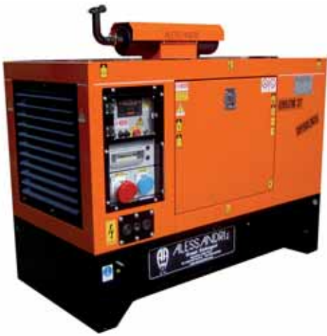
MOD. DP40C3T15/2 BOX 95 GRUPPO ELETTROGENO INSONORIZZATO DA 30 KVA DB/A 70

GRUPPI ELETTROGENI INSONORIZZATI DA 30 A 2000 KVA CON MOTORI "DIESEL" 1500 GIRI MECO - PERKINS - JOHN DEERE - DEUTZ - CUMMINS - VOLVO PENTA - MTU RAFFREDDATI A "LIQUIDO"