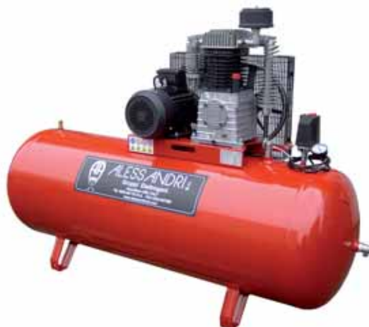
MOD. AT38GV.500.655 PF ELETTRICOMPRESSORE PROFESSIONALE 500 LT CON MOTORE ELETTRICO TRIFASE 7,5 Hp

HOBBISTICI-PROFESSIONALI INDUSTRIALI- INSONORIZZATI