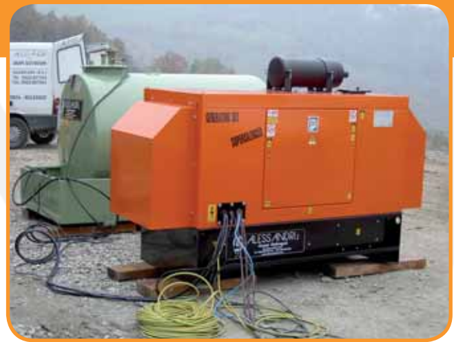
ALIMENTAZIONE CANTIERE GRUPPO INSONORIZZATO DA 60 KVA CON CISTERNA