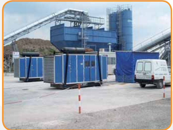
PRODUZIONE DI ENERGIA N.2 GRUPPI INSONORIZZATI DA 400 KVA