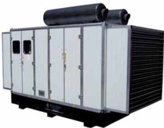
MOD. DP880V12ST15/2 BOX 95 GRUPPO ELETTROGENO INSONORIZZATO DA 800 KVA DB/A 70