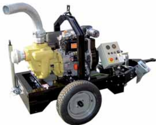
MOD. MPDA/B4XR.AST MOTOPOMPA AUTOADESCANTE PER IRRIGAZIONE CON MOTORE DIESEL LOMBARDINI ESECUZIONE BIGA