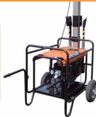
MOD. TA/B 5500/4 X 500 W - MOBILE TORRE H MT. 5,5 CON GRUPPO ELETTROGENO BENZINA MOD. BI8C1M3/1 - 7,5 KVA