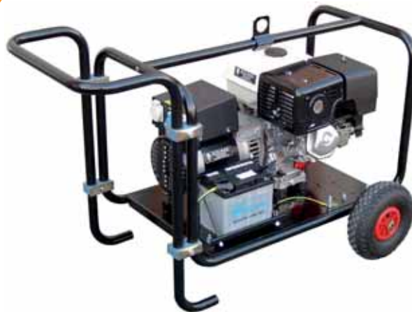
MOD. BH7C1M3/2 MOBILE - 6 KVA PICCOLI GRUPPI MONOFASI E TRIFASI CON MOTORE "HONDA" DA 3 A 8,5 KVA