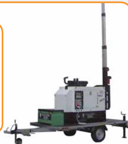
MOD. TA/D 9000/4 X 1500 W TORRE H MT. 9 ESECUZIONE SU CARRO OMOLOGATO CON GRUPPO ELETTROGENO DIESEL INSONORIZZATO DA 16 KVA