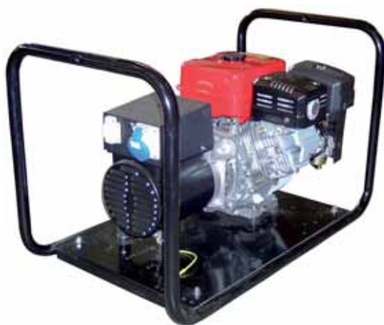
MOD. BR6C1M3/1 - 5 KVA PICCOLI GRUPPI MONOFASI E TRIFASI CON MOTORE "ROBIN SUBARU" DA 2,6 A 7,5 KVA