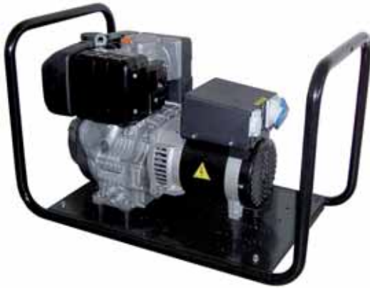
MOD. DL4C1M3/1.S4 - 4 KVA PICCOLI GRUPPI MONOFASI E TRIFASI CON MOTORI DIESEL "LOMBARDINI" DA 3 A 7 KVA

GRUPPI ELETTROGENI CON MOTORI "DIESEL" LOMBARDINI RAFFREDDATI AD ARIA