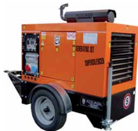
MOD. DIS20C3T3/2 BOX 95 - 16 KVA GRUPPI ELETTROGENI CON MOTORI RAFFREDDATI A LIQUIDO INSONORIZZATI DA 10 A 30 KVA