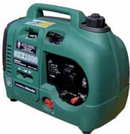
MOD. SHX 1000 - 1 KVA PICCOLI GRUPPI SILENZIATI CON MOTORE "HONDA" DA 0,75 A 2 KVA

GRUPPI ELETTOGENI CON MOTORI "BENZINA" LOMBARDINI - ROBIN SUBARU - HONDA