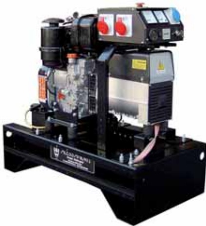
MOD. DL11C1T3/2.S3 - 10 KVA GRUPPI ELETTROGENI SERIE "LAVORO MAXI" CON MOTORI DIESEL "LOMBARDINI" DA 8 A 30 KVA