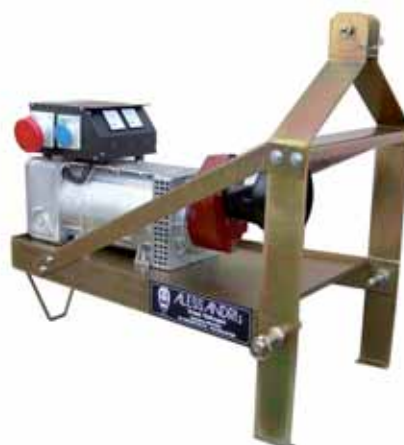
MOD. AC32T15.S3/B3P.F GENERATORE AGRICOLO ESECUZIONE B3P/F 27,5 KVA 1500 GIRI CON SUPPORTO FISSO PER APPLICAZIONE AL 3° PUNTO DEL TRATTORE