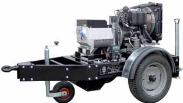
MOD. DLW14C2M3/2 - 10 KVA GRUPPI ELETTROGENI CON MOTORI RAFFREDDATI A LIQUIDO DA 10 A 30 KVA

GRUPPI ELETTROGENI CON MOTORI "DIESEL" LOMBARDINI - PERKINS - ISUZU RAFFREDDATI A "LIQUIDO"