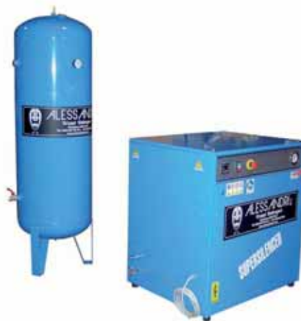
MOD. AT38G300.650.S ELETTRICOMPRESSORE SILENZIATO PROFESSIONALE CON MOTORE ELETTRICO TRIFASE 5,5 Hp E SERBATOIO VERTICALE 300 LT