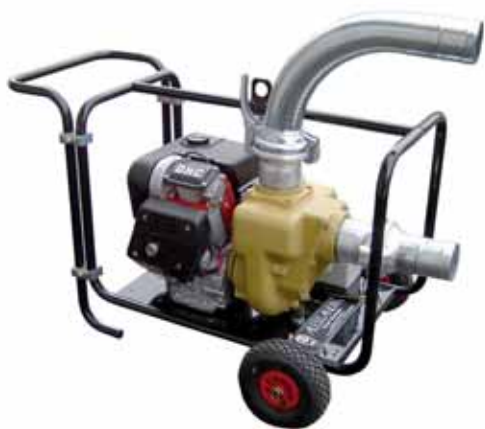
MOD. MPBA/B4KQ.AS1 MOTOPOMPA AUTOADESCANTE TIPO CANTIERISTICO CON MOTORE BENZINA LOMBARDINI ESECUZIONE MOBILE IDONEA PER ASPIRARE ACQUE SPORCHE E SABBIOSE

CANTIERE-IRRIGAZIONE-ANTINCENDIO CON MOTORI BENZINA E DIESEL