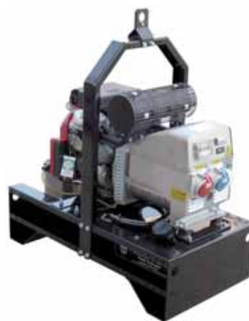
MOD. BH15C2T3/2 S4 GRUPPO ELETTOGENO TRIFASE 13,5 KVA SU BASE CON GANCIO DI SOLLEVAMENTO CON MOTORE "HONDA"