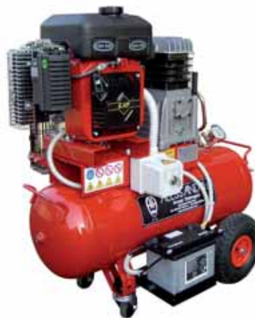
MOD. BI10G50/2.360/CAR MOTOCOMPRESSORE PROFESSIONALE 50 LT CON MOTORE BENZINA LOMBARDINI TIPO LGA226