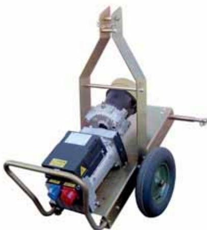
MOD. AC11T3.S4/B3P.M GENERATORE AGRICOLO ESECUZIONE B3P/M 11 KVA 3000 GIRI CON SUPPORTO MOBILE PER APPLICAZIONE AL 3° PUNTO DEL TRATTORE