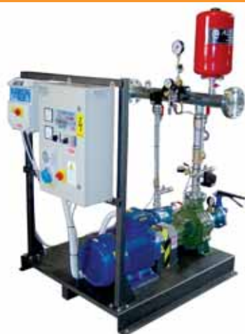
MOD. ALEX73/NCB40.250ND20/3 GRUPPO DI PRESSURIZZAZIONE ANTINCENDIO UNI 9490