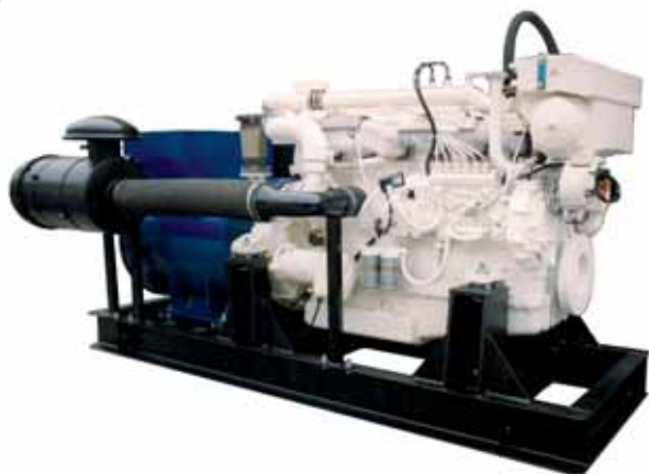
MOD. DIF460C6ST15/2 GRUPPO ELETTROGENO MARINO DA 350 KVA CON SCAMBIATORE

G.E. DA 30 A 1000 KVA CON MOTORI "DIESEL" 1500 GIRI