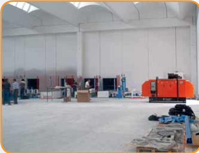
ALIMENTAZIONE INDUSTRIA GRUPPO SUPER SILENZIATO DA 150 KVA