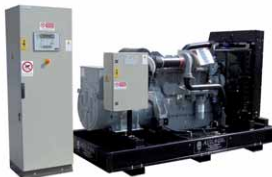
MOD. DP510C6ST15/3 - 400 KVA (Q. AUT. IS 80) GRUPPI ELETTROGENI ESECUZIONE APERTA CON MOTORI DIESEL "PERKINS" DA 30 A 2000 KVA