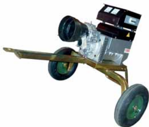
MOD. AC15T3.S3/M GENERATORE AGRICOLO ESECUZIONE MOBILE PER TRAINO LENTO 11 KVA 3000 GIRI